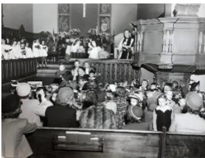
[6-Nativity scene at altar with children gathered and choir_year. Note: print and web. Caption: Nativity scene at the altar with choir and a gathering of children.]