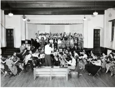
[4-Choir and orchestra In Atwood hall 1950. Note: print and web. Caption: The Choir and orchestra perform in Atwood House, 1950.]