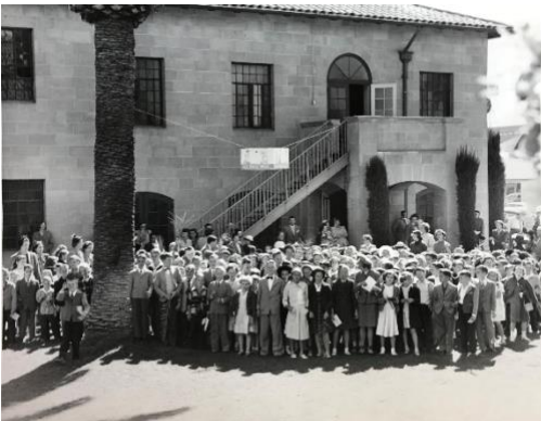
[3-children in front of Atwood Hall – 1950_. Note: print and web Caption: Many of the Cathedral’s children in front of Atwood House in 1950..]